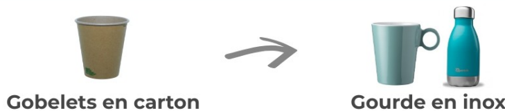
Gobelets en carton

L'intérieur des gobelets en carton est imperméabilisé grâce à un film plastique.