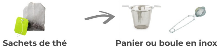
Sachets de thé

Selon une étude canadienne, un seul sachet de thé en nylon ou PET relâcherait des milliards de microplastiques.