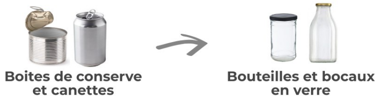
Boîtes de conserve et canettes

Un vernis plastique, appelé epoxy et contenant souvent des bisphénols, recouvre l'intérieur des boîtes de conserve et canettes.